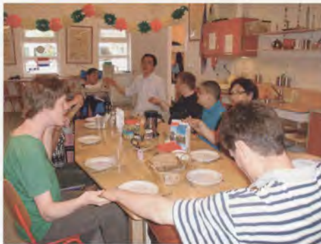
De gezamenlijke lunch om twaalf uur