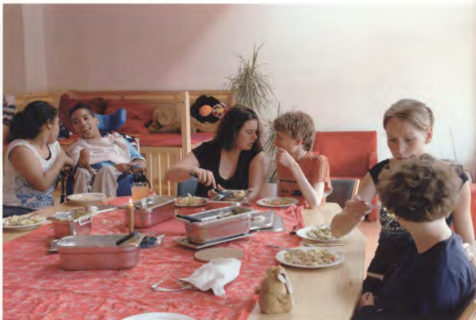
Begeleiders en bewoners van woonhuis Karmijn tijdens de maaltijd

In de woonhuizen wordt veel werk gemaakt van 'gemeenschapsvorming'. Dit betekent dat bewoners zich in het contact met anderen, bijvoorbeeld door het maken van uitstapjes en culturele avonden, sociale vaardigheden eigen maken.